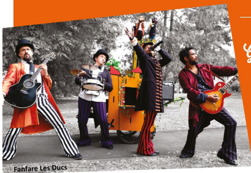
Fanfare Les Ducs