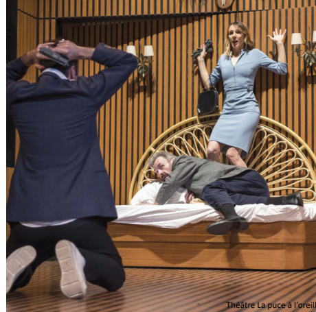
Théâtre La puce à l'oreille