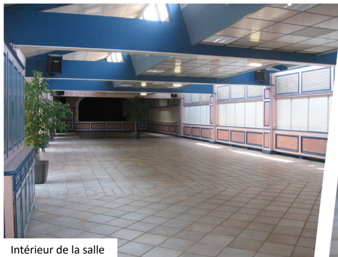
Intérieur de la salle