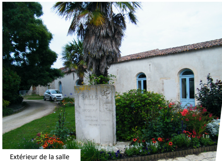
Extérieur de la salle