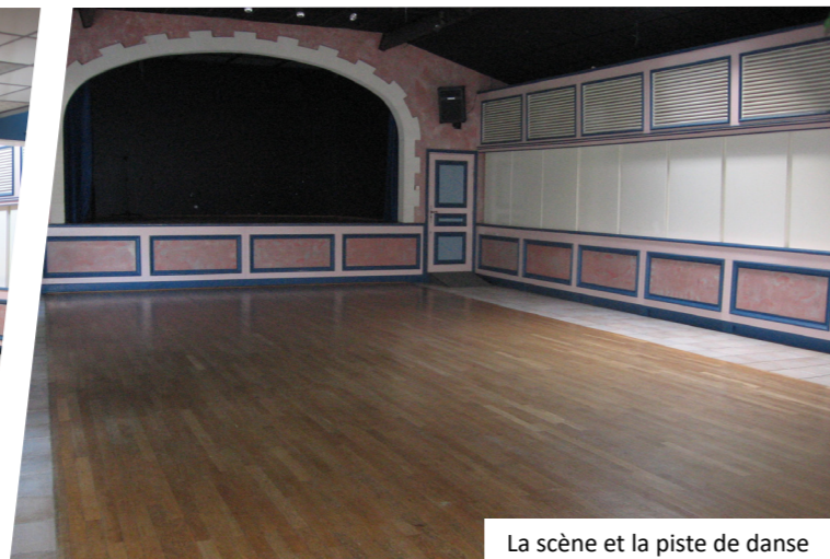
La scène et la piste de danse